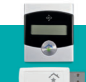
Energy Control inkl. Empfangseinheit € 149,95