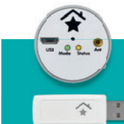
Power Control inkl. Empfangseinheit € 179,-