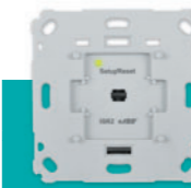
Unterputz-Rollladensteuerung € 99,95