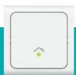
Wandsender € 39,95