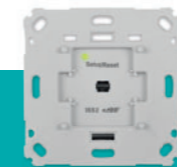
Unterputz-Lichtschalter € 69,95