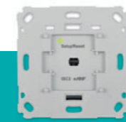
Unterputz-Sender € 59,95