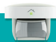
Bewegungsmelder (außen) € 75,95