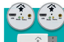
Power Control solar inkl. Empfangseinheit € 279,-