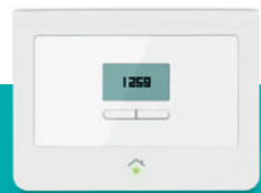
Zentrale € 189,-