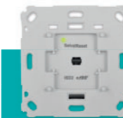
Unterputz-Dimmer € 79,95