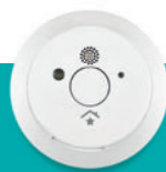
Rauchmelder € 49,95