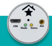
Power Control € 129,95